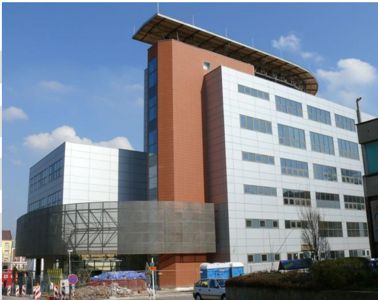
Budova Integrovaného bezpečnostního centra – květen 2010.

V Moravskoslezském kraji se rodí unikátní projekt operačního a krizového řízení bezpečnostních a záchranných složek v podobě Integrovaného bezpečnostního centra. Jedná se o komplexní řešení, které nemá v Evropském měřítku obdoby. Projekt se tak může stát modelem a inspirací nejen pro podobná střediska napříč celou Českou republikou, ale také v EU.