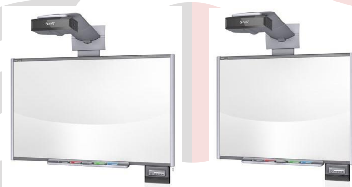
Interaktivní projekční sestava SMART Board 685/16:10 a 680/4:3