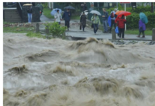
Moravskoslezský kraj sužuje velká voda. Voda komplikuje dopravu, je vyhlášen kalamitní stav.