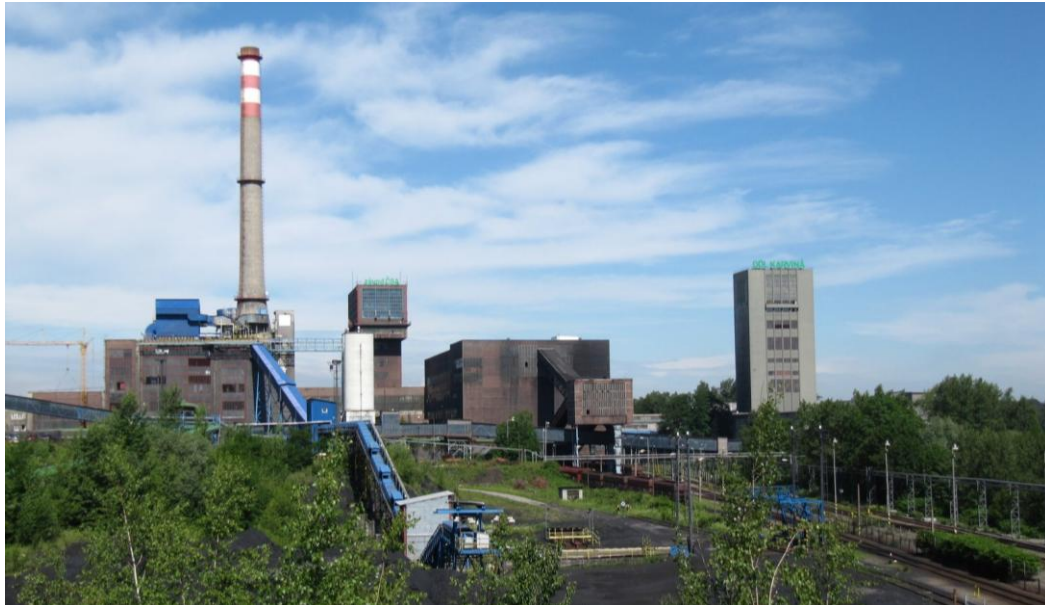
Důl Karviná, závod ČSA

Dne 17. 5. 2010 došlo, po mohutných deštích, na území Moravskoslezského kraje k rozsáhlým záplavám s nutností vyhlášení stavu ohrožení. Kritická situace se nevyhnula ani oblasti Karvinska. Všechny přístupové cesty do města Karviná byly uzavřeny, stejně jako i cesty či železniční spoje do Polska a do řady dalších lokalit.