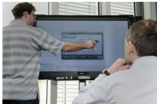
Zasedací místnost a kancelář vedoucího odboru vybavena interaktivní tabulí a dotykovou plazmou SMART Board.

Jaké další metody moderní komunikace používáte?